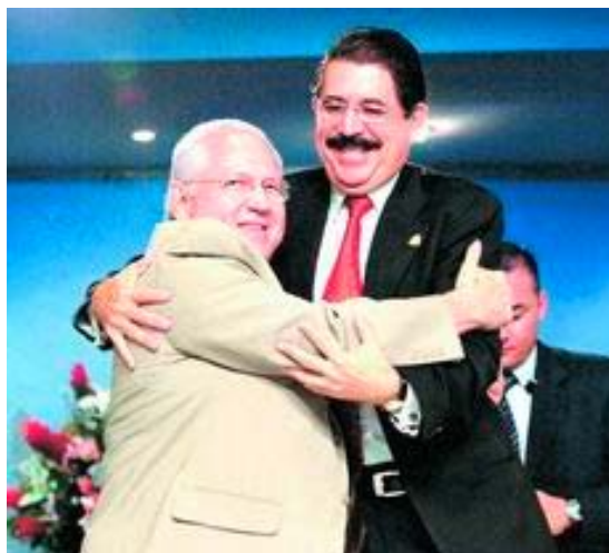
JUNTOS. Los liberales han limado asperezas en Santa Bárbara.

1 Santa Bárbara. La Asamblea del Poder Ciudadano efectuada aquí por el presidente Manuel Zelaya y su gabinete de gobierno se convirtió en una pasarela de los aspirantes presidenciales del Partido Liberal para medir quién arrancaba más aplausos. En este lugar, el gobierno repartió 5,000 bonos del programa Red Solidaria, que dirige la primera dama Xiomara Castro de Zelaya.